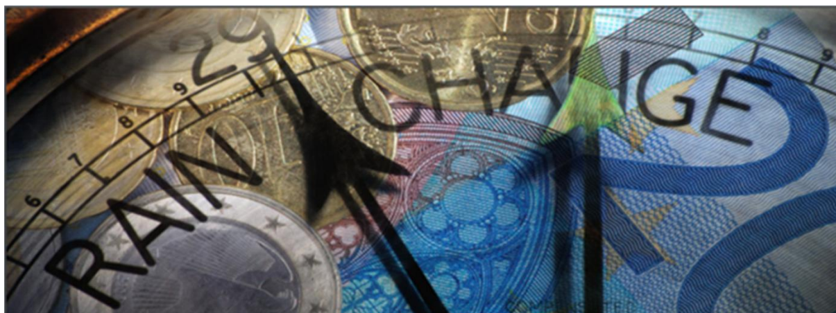
Sledované oblasti – v čase